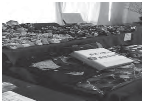
作品展で販売し、被災地に寄付! モチベーションが上がります!