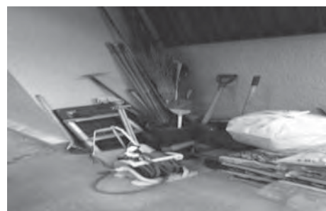
3) 4) こどもサロン・アウトリーチで使 う道具