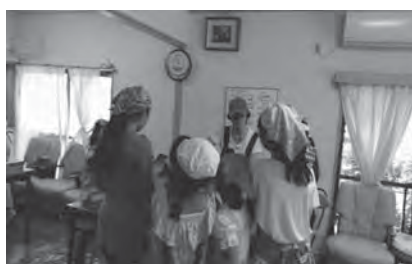
3) こどもサロン：収穫したジャガイモを調理中