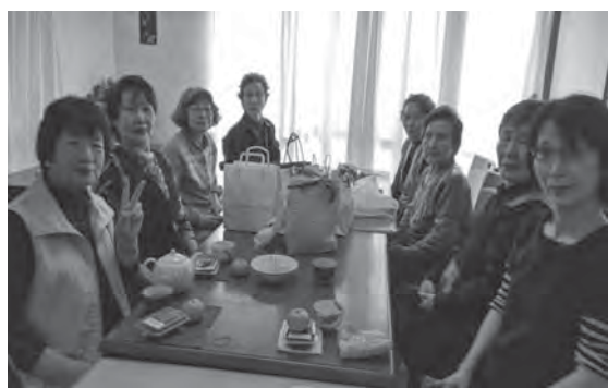
手芸の部屋: 90歳の方も頑張っています!