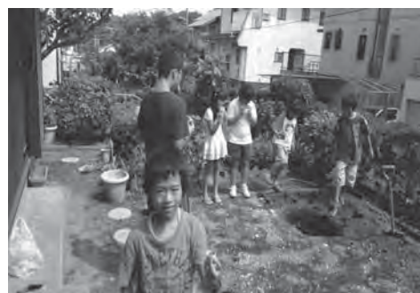
西瓜割の後は、畑の肥料に！