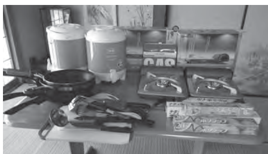
3) 子どもサロン: 調理器材を購入しました!