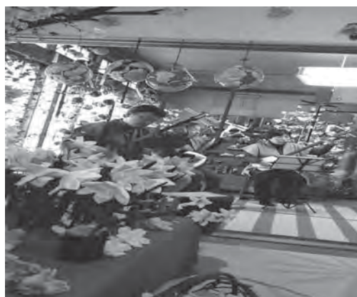
作品展と三味線発表会