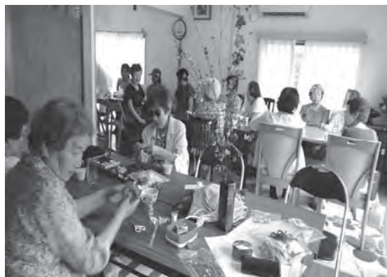
2) 手芸の部屋(月1~2回)一人暮らし高齢者