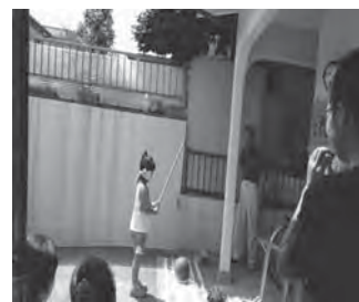
8月：こどもサロンの西瓜わり ました！