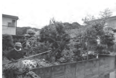
庭 木 の 手 入 れ