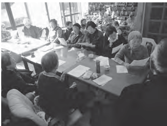
1) 高齢者茶話会 月1回(第1土曜日)