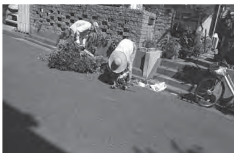
アウトリーチ事業：庭木の伐採 2