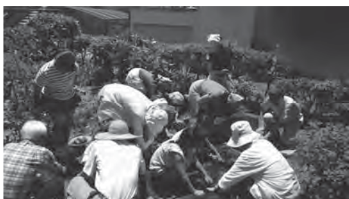
3) こどもサロン：6月 春休みこども サロンで植えたジャガイモ掘りをして スペイン風オムレツにして食べました