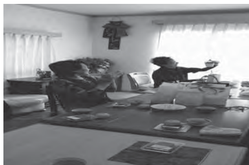
手芸の部屋 どの作品を出展しようかな!