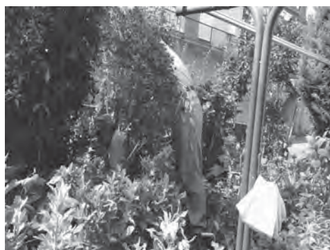
4) アウトリーチ事業：庭木の伐採 1 高齢者世帯の生活支援に好評です！

スペイン風オムレツ作りしました！ ジャガイモ 以外の食材は、参加費と 助成金を活用しました！