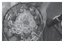
7月パスタ作りまし た！畳の上には、補助 金で購入したブルー シートを敷きまし た！