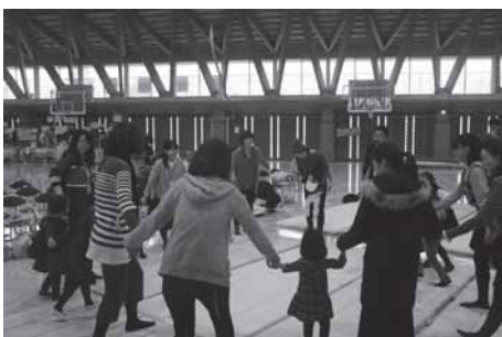
歌に合わせてのダンス (会場巻き込み型)