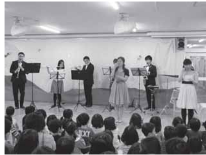
保育園でのコンサート (2017/3/30)