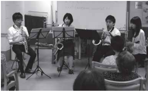
介護施設でのコンサート (2016/9/22)