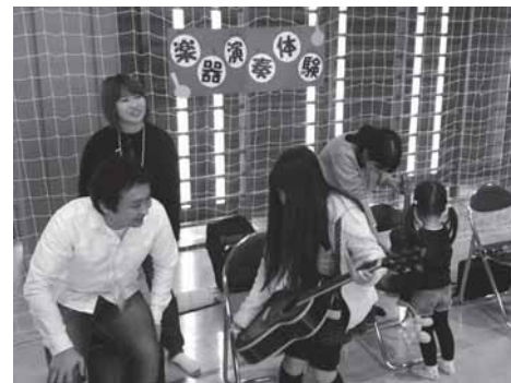
楽器体験コーナー