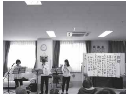
病院でのコンサート (2017/3/19)