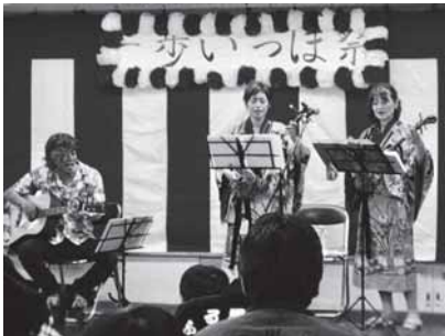
障害者支援施設でのコンサート (2016/10/29)