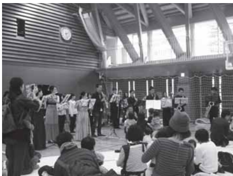
出演者全員での合奏