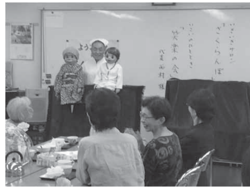
腹話術2体演技（おばあさんとお医者さん）