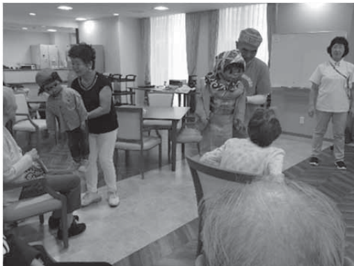
楽しかったですか？いつまでもお元気で！