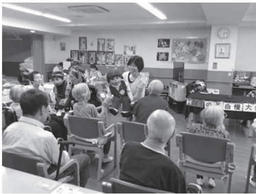
ぼく！可愛いでしょう。お元気で！