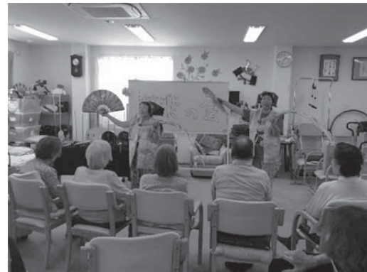
南京玉すだれ（あッそれー・あッそれー）