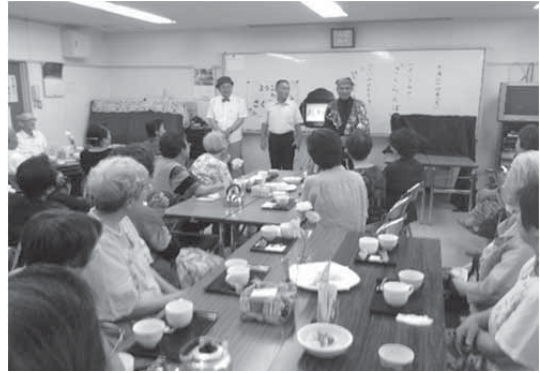
皆さん一緒に楽しみましょう