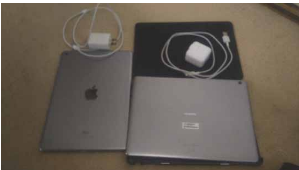
レンタル品写真 会場にインターネット環境がないためレンタル品で賄う

購入部材写真 android7.0 タブレット端末 MediaPadM3 1 台 Ipad MP2G2J/A 1 台 相談会実施時症状再現や相談者への説明に使用