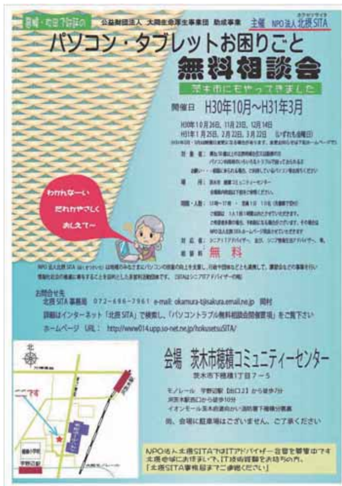
実施広報用チラシ A4判