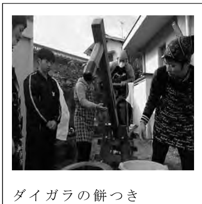
ダイガラの餅つき