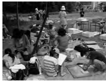
生きもの観察（写生）