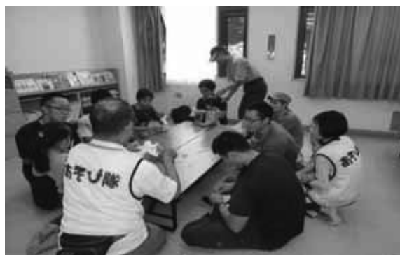
9月浜手公民館パパサロン