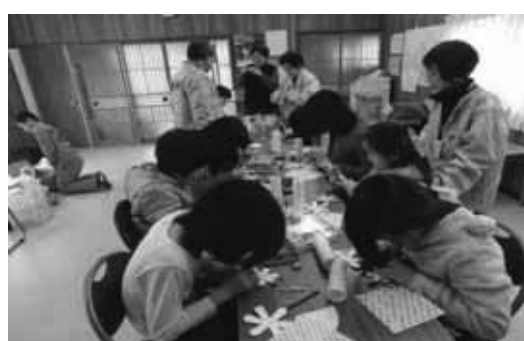
3月 澤町東和苑子供会