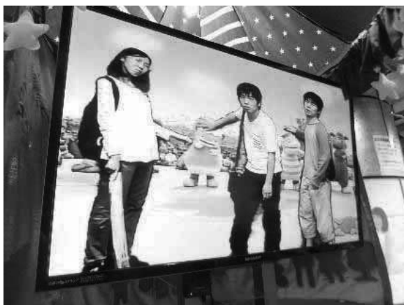
9月 NHK「あさが来た」収録現場と大阪城へ