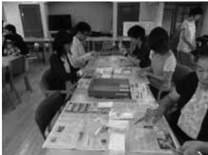
ジョブ・トレーニング