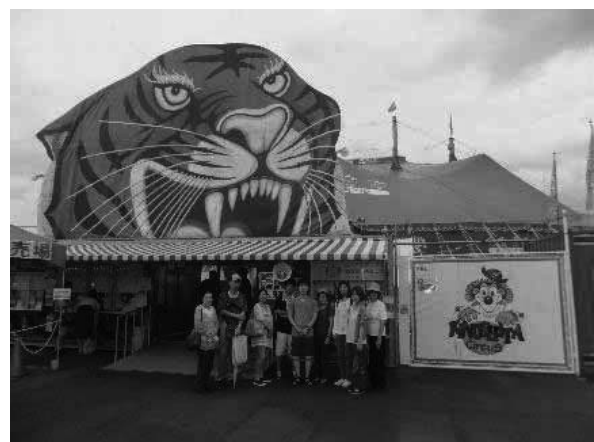
9月 木下大サーカス