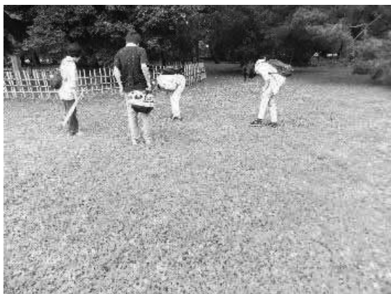
6月 裁判傍聴の合間に向いの京都御苑で