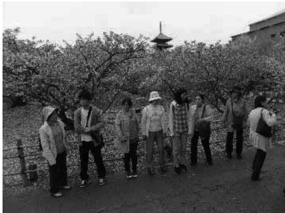
4月 世界遺産 御室仁和寺