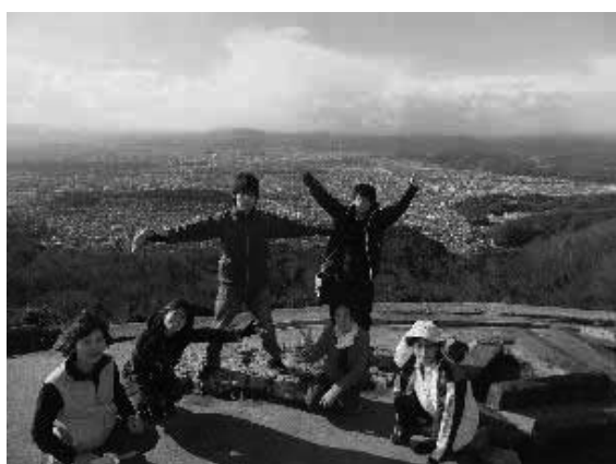
2月 大文字山 登山