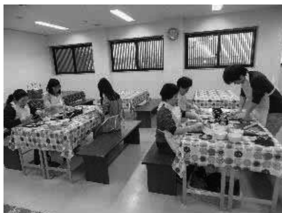
1月 おたべ作り 体験