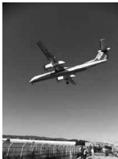
10月 大阪空港 千里川土手