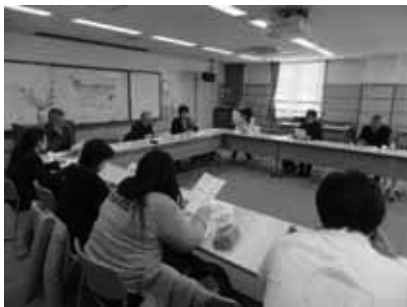
地域交流会 研修会 親の会 連絡会議など