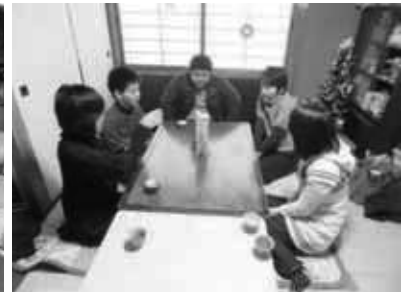
クリスマス会・新年会