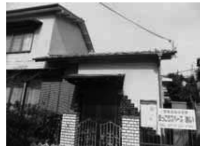
面談 相談 counseling 就業支援など