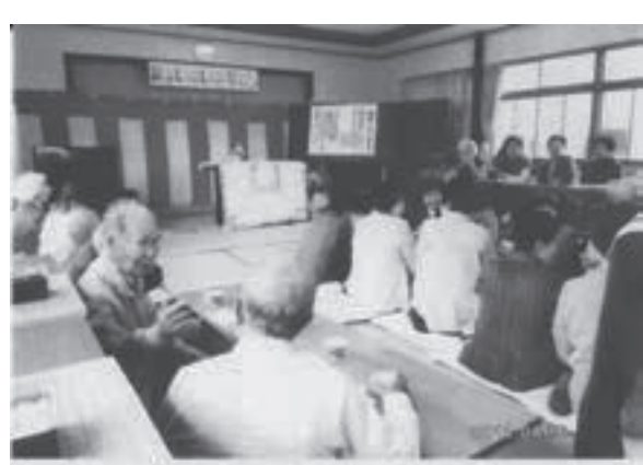
いきいきサロン腹話術開演直前