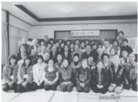
警察署交通安全漫談講師を迎えて (左側の若い女性)