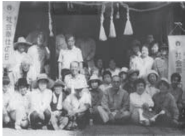
社会奉仕の日、ちょっと記念写真