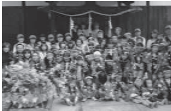
町内会子供「みこし」祭の交通安全のガード役支援