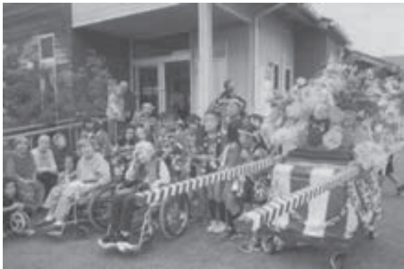
町内会子供「みこし」介護施設訪問