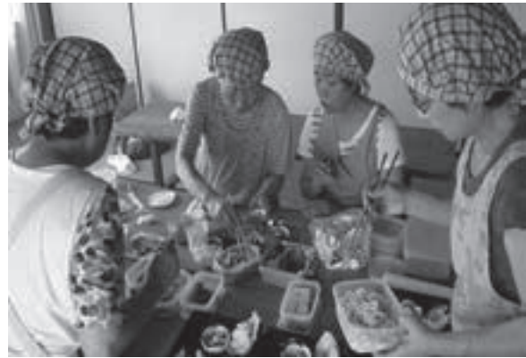
独居高齢者へ手作り弁当づくり