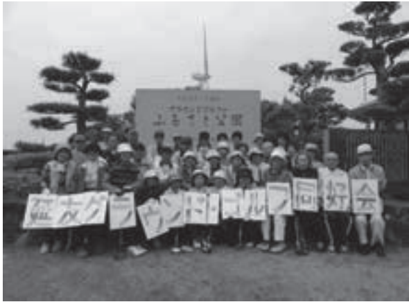
老若問わず呼び掛け記念大会