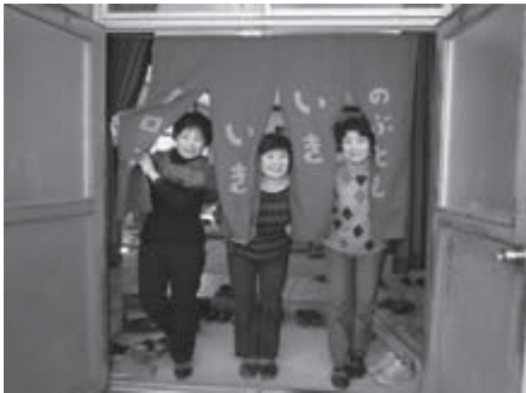
開店日手作りののれん