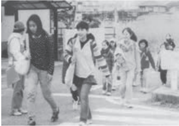
学童の登下校見守り隊出動