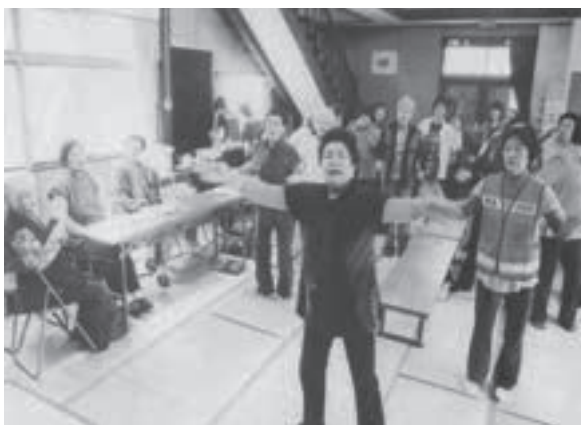
いきいきサロン健康体操