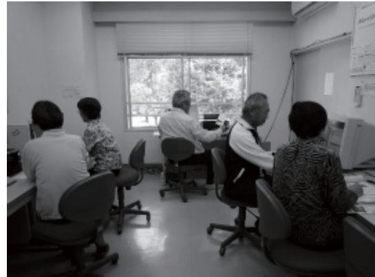
1対1の指導が好評です

私どもの教室ではワープロソフトはジャストシステムの「一太郎 2005」を使用していました。この度、助成金の一部で「一太郎 2011”創”」を購入し既存の PC にインストールして今年度(第 21 期)の講座から使用しています。新機能満載ですがシンプルで使いやすく特にツールパレットが表示されるようになり操作性が向上し受講生には大変好評です。