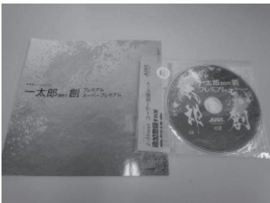
アプリケーションソフト 一太郎 2011”創”