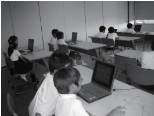
みんな楽しいパソコンの時間