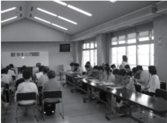
左側が受講生 右側が講師です