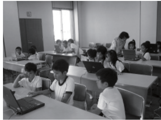
仲良く交代しながら・・・

平成10年から児童の健全育成を支援する目的で、低学年児童に対してパソコンの指導を行っています。毎年5月から翌年3月まで毎月実施、1施設にKSCの会 会員3名が出向いています。今年度は3施設で136名の児童が学んでいるところです。