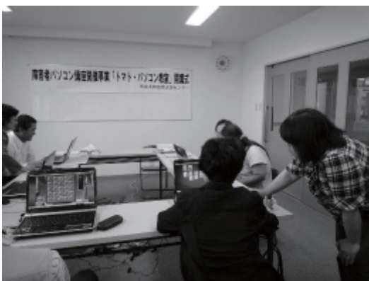
熱心に学習 ゲームは得意！