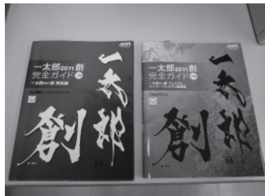
解説書 上巻・下巻

高齢者・障がい者パソコン入門講座は平成 8 年有志により発足、以来 15 年が経過しました。修了者は昨年第 20 期生で 522 名となりました。修了者のうち意欲のあるボランティア志向の高い者が会員となり、常に自己研鑽に励み講師を務めています。今後も会員の資質向上のため学習の機会をつくと共に若い会員の養成に努めたいと思っています。