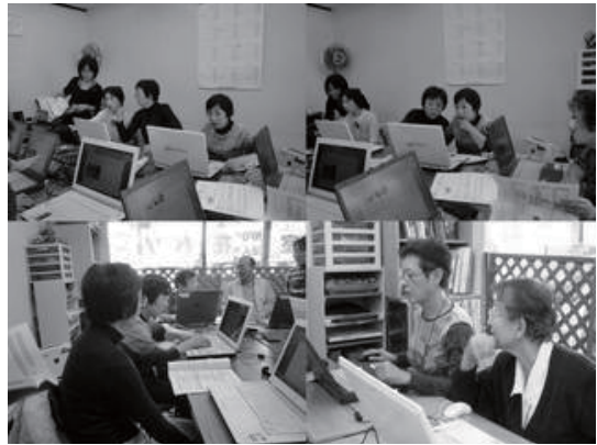
ひとまち交流館・花パソにてミニコミ誌講座風景