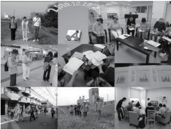
ウォーキング講座