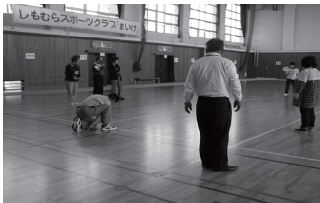
最近取り入れた ディスコンを楽しむ

高齢者支援 ・病院の通院支援、買い物支援等を会員制で実施 利用会員 6人 月1～2回程度 サポーター 5人 今年度のサポート回数は合計 123回実施 ・交流サロンの開所 月・水・木の週3日間 午前10時～13時開所 利用状況は別紙のとおり、開所日数 139日 来所者延べ 254人 実施内容については、毎月サロンのお知らせを発行。書道教室、小物作り、最近はパークゴルフやディスコンという新しいスポーツも取り入れて健康づくりにも取り組んでいる。