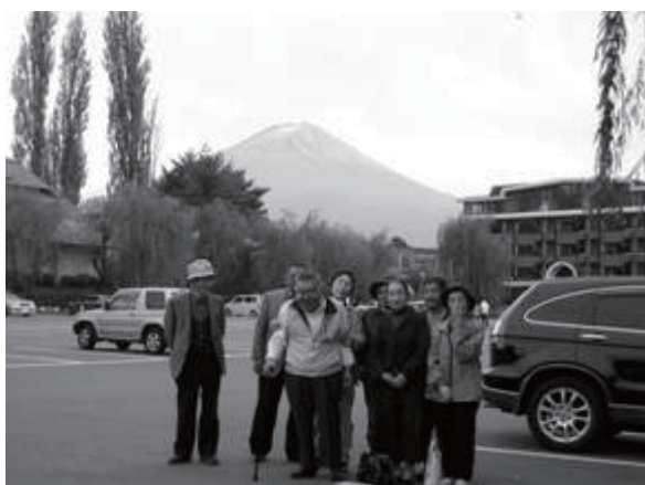
高令の利用者の声