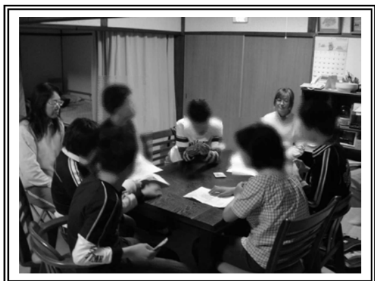
(写真4 話し合いの場)

9月は1年間のまとめとして、振り返りをおこなった。1年前は他者の話を最後まで聞くことが苦手だった子どもたちが、今は他者の話を聞き、自分の話をする、ということが出来た。