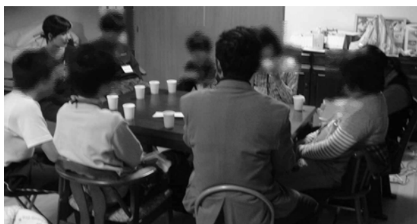
(写真1 話し合いの場)

循環が見られた。その度にスタッフと子どもが納得するまで話し合い改善策を考え実行した。そうしていくうちに工作の出来不出来よりも自ら努力し皆と同じものを作ったという達成感を得ることにより、前半目標の「話を聞くこと、順番を待つこと、ルールを守ること」は達成され始めた。