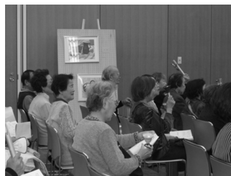
B群：自治会内の地域会館

B群：自治会内の独居生活の方や高齢の方々は、初めは歌も静かで遠慮がちな取り組みにみえましたが、トーンチャイム、ミュージックベル、ウインドーチャイム、レインスティック、フィンガーベル、鳴子など、普段、手に取ることの無い珍しい楽器を演奏されるうちに、いろいろな音色に興味や関心を示し演奏を繰り返していきました。