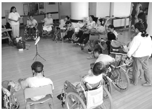
A群：身体障害者療護施設にて

第Ⅳ期：参加者同士との関わりを持ちながら、積極的に日本昔話：音楽朗読劇「花咲き爺さん」を演じ合い、役柄に成りきり感受性を豊かにすることの楽しさを感じ合いました。又、コミュニケーションを取りながら発語を促す活動にも発展しました。