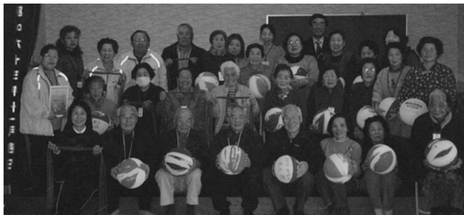
今区健康づくり語らい会集合写真