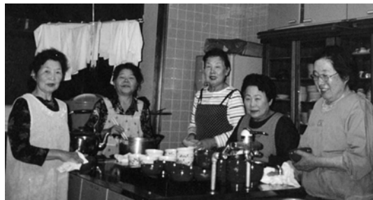
会食準備ボランティアチーム