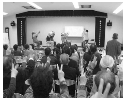
菊池市地域福祉フォーラムで 体操実演